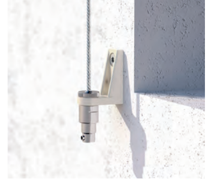
Wandhalter inkl. Federspanntopf