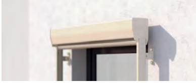
VS4300 Eckiger und runder Kasten