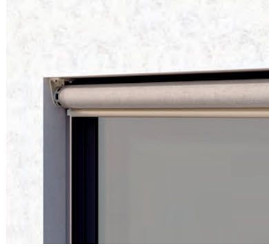
S4110 Ohne Kasten